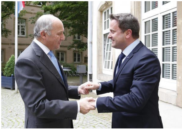
Le Président du Conseil constitutionnel français Laurent Fabius accueilli par le Premier ministre Xavier Bettel

Les discussions portaient essentiellement sur l'actualité politique européenne et internationale. Lors de sa visite, Laurent Fabius s'est également rendu à la Cour de justice de l'Union européenne.