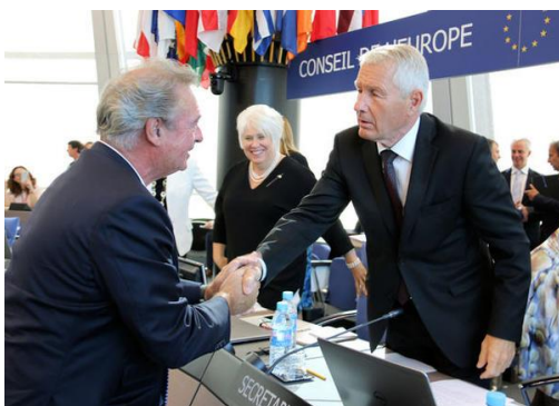
(de g. à dr.) le ministre Affaires étrangères et européennes du Luxembourg, Jean Asselborn; la Présidente du Comité des Ministres et ministre estonienne des Affaires étrangères, Marina Kaljurand, Marina Kaljurand; le secrétaire général du Conseil de l'Europe, Thorbjørn Jagland

La réunion du Comité des ministres a été conviée par la présidence estonienne du Conseil de l'Europe afin d'avoir un échange de vues avec le ministre des Affaires étrangères de Turquie, Mevlüt Çavuşoğlu. Le Comité des ministres s'est penché sur les mesures prises par les autorités turques depuis la tentative de coup d'État du 15 juillet dernier, ainsi que sur les actions que le Conseil de l'Europe peut entreprendre pour accompagner la Turquie dans la gestion de la réponse à la tentative de coup d'État, tout en tenant compte de la responsabilité collective dans la mise en œuvre de la Convention européenne des droits de l'homme et de l'exécution des arrêts de la Cour européenne des droits de l'homme.