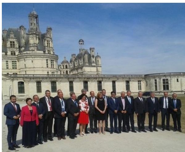
Photo de famille devant le château

Les aspects les plus stratégiques, les défis, ainsi que le rôle et la place de la PAC étaient à l'ordre du jour des réunions qui se sont tenues tout au long de la journée d'aujourd'hui.