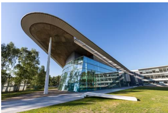
L'INSA - Institut National des Sciences Appliquées de Rouen où aura lieu la manifestation.

Suite aux premiers liens amorcés avec l'écosystème Rouennais en décembre dernier ( détails ici ), la Chambre de Commerce de Luxembourg, l'Ambassade du Luxembourg à Paris et le Business Club France-Luxembourg, ont le plaisir de vous convier à participer à la “ Journée des Ecotechnologies ” qui aura lieu le 29 septembre prochain sur le Technopôle du Madrillet à Rouen (France) et lors de laquelle le Luxembourg sera pays invité d'honneur.