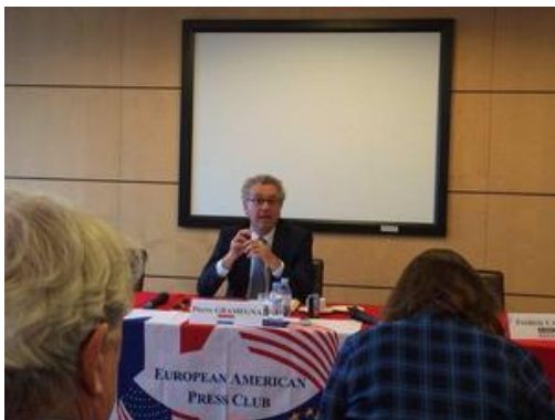
Le ministre, Pierre Gramegna, au European American Press Club

La rencontre avec les Consuls honoraires réunis à la Résidence de l'Ambassadeur pour une matinée de travail a permis au Ministre de présenter les derniers indicateurs de la situation économique du pays - perspectives de croissance au-delà de 4%, chômage autour de 6% avec une création nette d'emplois de 2% par an -, des chiffres encourageants qui témoignent du dynamisme et de la résilience de l'économie luxembourgeoise. Le ministre a également évoqué l'avenir et les perspectives de développement et de diversification du pays autour, notamment, des secteurs de l'automobile, de la logistique, de l'environnement, des biotechnologies, des technologies financières (Fintech) et de l'espace (satellites, space-mining ). Cette rencontre a également été l'occasion d'un échange animé autour des enjeux et des moyens de la promotion du Luxembourg dont le réseau consulaire constitue l'un des importants leviers.