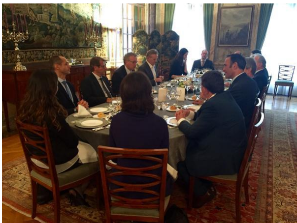
Déjeuner de travail du ministre Pierre Gramegna avec les Consuls honoraires du Luxembourg en France

La rencontre avec les Consuls honoraires réunis à la Résidence de l'Ambassadeur pour une matinée de travail a permis au Ministre de présenter les derniers indicateurs de la situation économique du pays - perspectives de croissance au-delà de 4%, chômage autour de 6% avec une création nette d'emplois de 2% par an -, des chiffres encourageants qui témoignent du dynamisme et de la résilience de l'économie luxembourgeoise. Le ministre a également évoqué l'avenir et les perspectives de développement et de diversification du pays autour, notamment, des secteurs de l'automobile, de la logistique, de l'environnement, des biotechnologies, des technologies financières (Fintech) et de l'espace (satellites, space-mining ). Cette rencontre a également été l'occasion d'un échange animé autour des enjeux et des moyens de la promotion du Luxembourg dont le réseau consulaire constitue l'un des importants leviers.