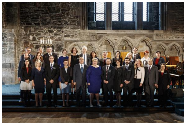
Photo de famille autour (au centre) de Mme Erna Solberg, Première ministre de Norvège, M. Ángel Gurría, secrétaire général de l'OCDE et M. Torbjørn Røe Isaksen, Ministre de l'Éducation et de la recherche de Norvège (Le Ministre Schmit est au second rang tout à gauche.)

Le ministre du Travail, de l'Emploi et de l'Économie sociale et solidaire, Nicolas Schmit, s'est rendu à Bergen en Norvège les 29 et 30 juin 2016 pour assister au Sommet des compétences organisé par l'Organisation de coopération et de développement économique (OCDE).