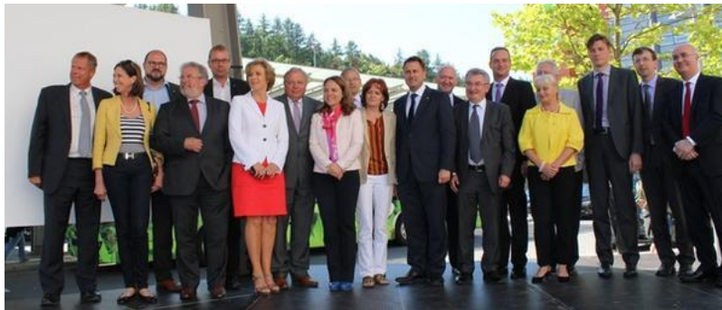
La Ministre Corinne Cahen avec des acteurs politiques de la Grande Région

Il y a un an, le 17 juin 2015, la nouvelle Maison de la Grande Région a été inaugurée à Esch-sur-Alzette à l'initiative de la ministre Corinne Cahen.