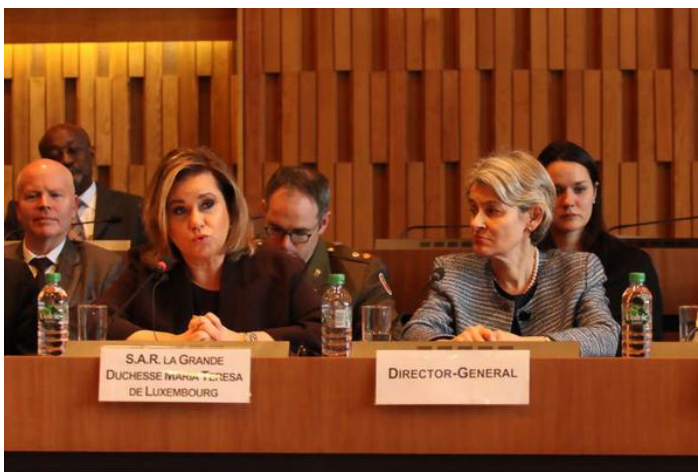
S.A.R. la Grande-Duchesse Maria-Teresa au côté de la Directrice générale de l'UNESCO, Irina Bokova

Portant sur le rôle des femmes comme auteurs, victimes et agentes du changement dans la lutte contre l'extrémisme violent et la radicalisation, la table ronde présidée par Mme Irina Bokova, directrice générale de l'UNESCO a fourni l'occasion aux expertes internationales de mettre en avant l'importance du rôle de la femme en tant que vecteur positive en réponse à la radicalisation et au terrorisme.