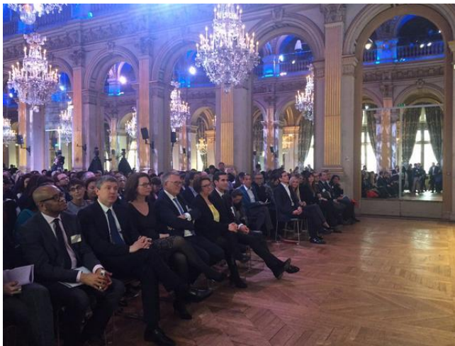
Le Ministre Nicolas Schmit (au centre) lors la Conférence Impact2

Le ministre a effectué une visite d'Antropia, l'incubateur pour entrepreneurs sociaux de l'ESSEC . Il a également pris part, à l'hôtel de ville, à la conférence "IMPACT2" dont c'était la cinquième édition. Cette conférence organisée par le Comptoir de l'innovation rassemble traditionnellement des décideurs économiques et politiques, des entrepreneurs et des financeurs issus du monde entier pour promouvoir l'entrepreneuriat social et la nouvelle économie.