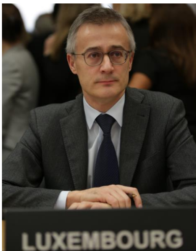
Félix Braz, ministre de la Justice

Le ministre de la Justice, Félix Braz, a participé le 16 mars 2016 auprès de l'OCDE à Paris à une réunion ministérielle sur la lutte contre la corruption. Cette réunion a regroupé les ministres de la justice des États signataires de la convention de l'OCDE sur la lutte contre la corruption qui établit des normes juridiquement contraignantes tendant à ériger en infraction pénale la corruption d'agents publics étrangers dans les transactions commerciales internationales. Elle prévoit également un certain nombre de mesures permettant une mise en œuvre efficace de ces dispositions dont notamment un processus d'évaluation des pays signataires.